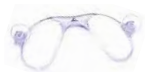
Adapter 33 850 9000