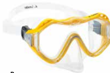
Rumena 33 850 1001