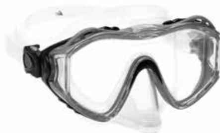
Siva 33 750 1001