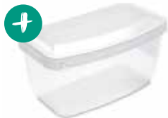
Vključno s plastičnim etuijem