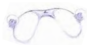
Adapter 33 750 9000