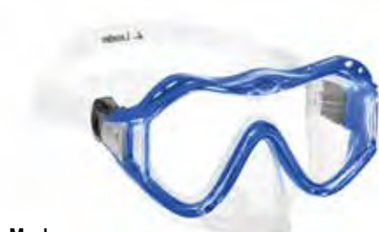
Modra 33 850 0001